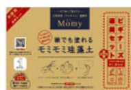
ビギナーズセット (徳用箱5.4kg+道具セット)